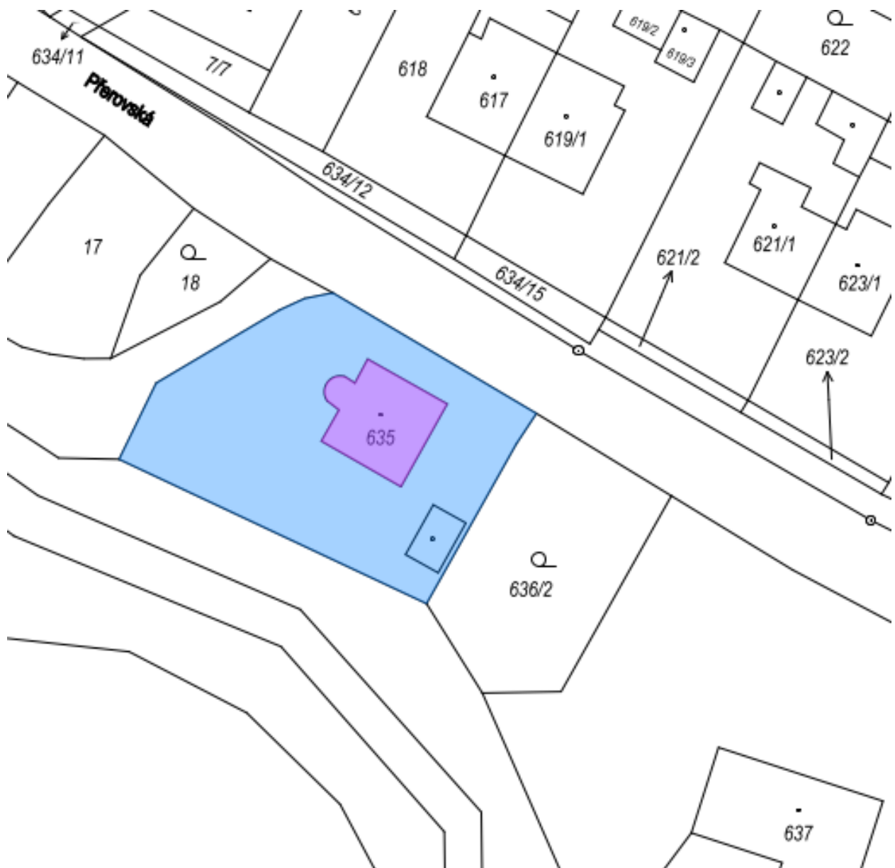
Obr. č. 1. Situace